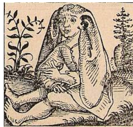
U atec z Norimbersk  kroniky