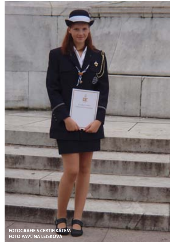
FOTOGRAFIE S CERTIFIKÁTEM

Zaskočena novým prostředím, cizí kulturou a neznámými lidmi, kterým jsem i přes sedm let studia angličtiny moc nerozuměla, jsem usoudila, že nejlépe zapadnu do nové společnosti a zbavím se šíleného stesku po domově skrze známé aktivity. Kontaktovala jsem tedy lokální Girl Guides a pustila se do hledání oddílu orientačního běhu.