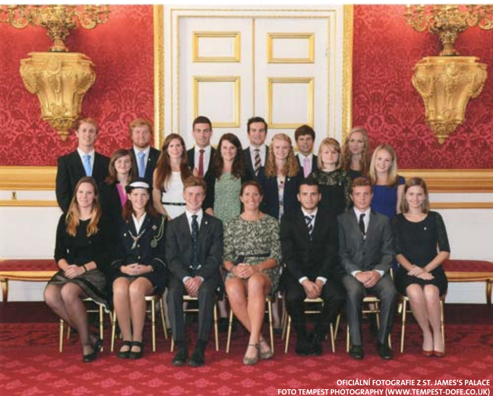
OFICIÁLNÍ FOTOGRAFIE Z ST. JAMES'S PALACE FOTO TEMPEST PHOTOGRAPHY (WWW.TEMPEST-DOFE.CO.UK)

Jde o mezinárodní ocenění, které má tři úrovně – bronzovou, stříbrnou a zlatou a jeho cílem je rozvoj mladých lidí. The Duke of Edinburgh Award je charitativní organizace, pracující pod záštitou Jeho Královské Výsosti hraběte z Edinburghu. Umožňuje mladým lidem, kteří by si to jinak nemohli finančně dovolit, účast na různých mimoškolních aktivitách. Samotná DofE Award se skládá ze čtyř částí. Tři části jsou dlouhodobé - mohou trvat 6 až 18 měsíců podle úrovně a jsou to sportovní aktivita, dovednost a dobrovolnictví. Čtvrtá část je dobrodružná expedice. A u zlaté úrovně je navíc ještě pátá část, akce s pobytem, nejméně pětidenní pobyt mimo domov s neznámými lidmi zaměřený na jakékoliv téma. Já jsem například