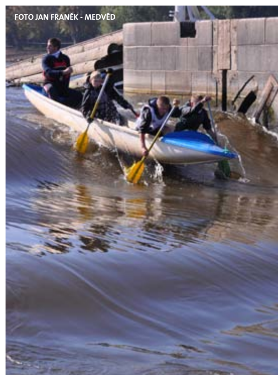
MEDVĚD