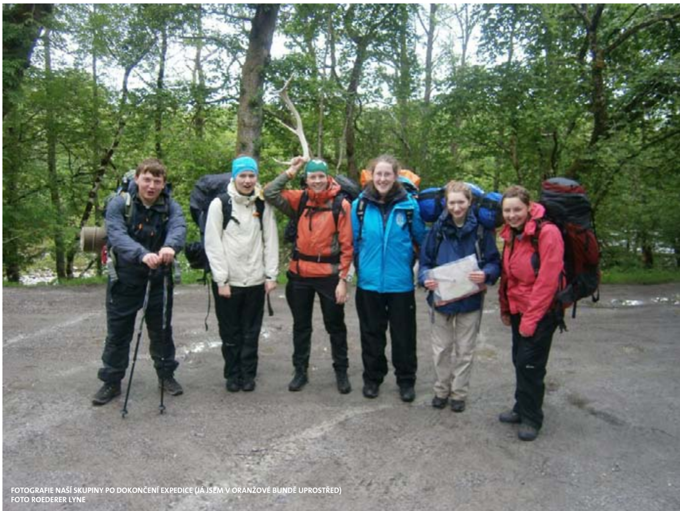
FOTOGRAFIE NAŠÍ SKUPINY PO DOKONČENÍ EXPEDICE (JÁ JSEM V ORANŽOVÉ BUNDĚ UPROSTŘED)

A pokud byste chtěli vědět více o středoškolských stipendiích do Velké Británie a USA tak se můžete podívat na stránkách www.osf.cz .