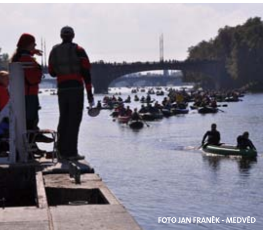
MEDVĚD